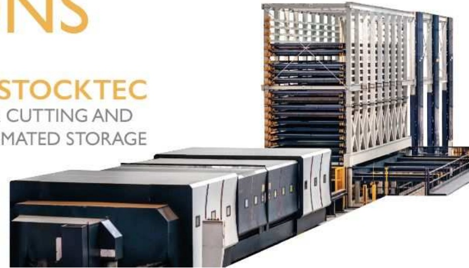
LS+STOCKTEC LASER CUTTING AND AUTOMATED STORAGE