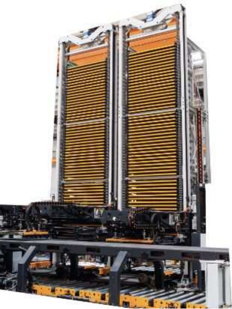
PACKTEC AUTOMATED SORTING AND PACKAGING