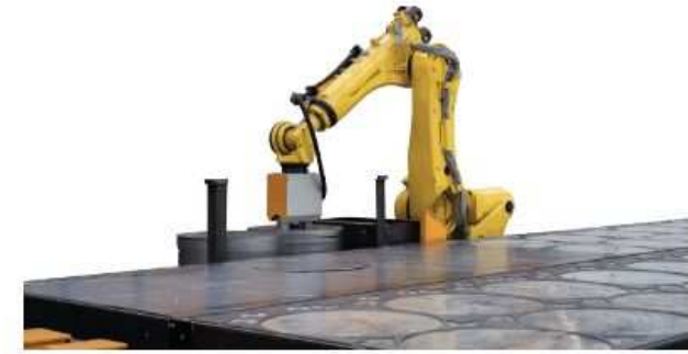
ROBOTEC SORTING AND PICKING