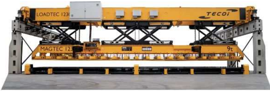
LOADTEC AUTOMATED PLATES HANDLING